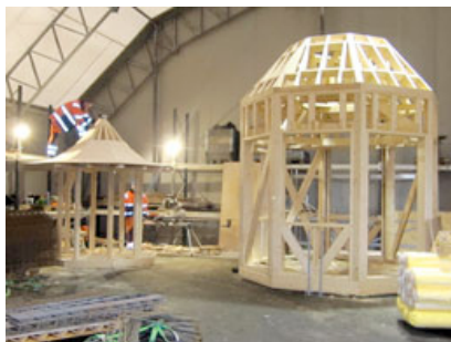
Lysthuset under bygging Januar 2017.