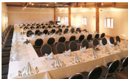
Storsalen på låven

På lokalmattorget kan du kjøpe og smake på mange forskjellige småretter. Finn et ledig bord, og nyt maten, stemningen. Kjøp med deg ingredienser av god kvalitet til lune måltider utover høst og vinter, eller til et gourmetmåltid i nærmeste framtid.