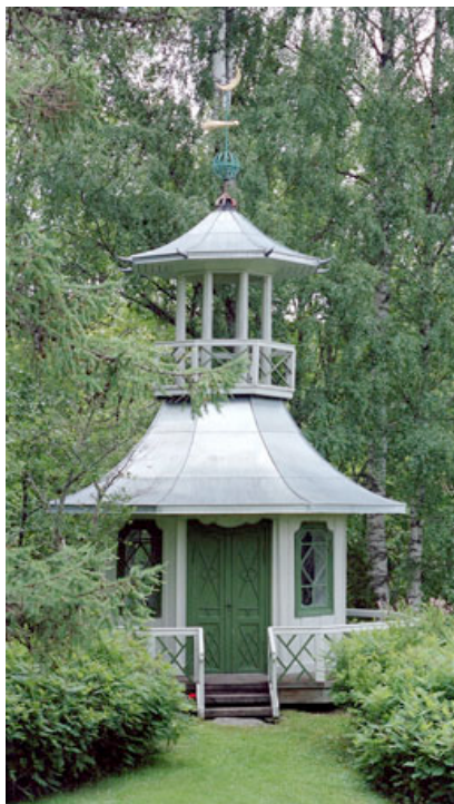
Lysthuset på Odals Værk som er forbilde for vårt lysthus.