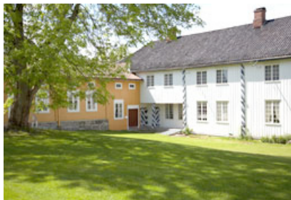
Herregården ligger i vakre omgivelser.