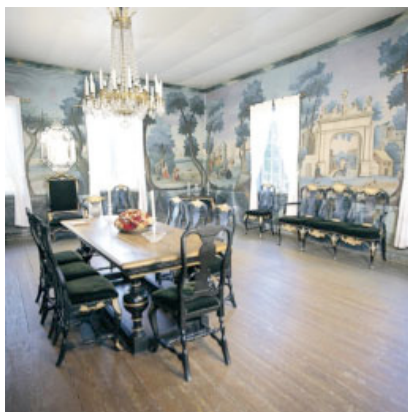
Storstuen, her er de originale lerretstapetene bevart. Vi gleder oss svært til at også dagligstuen skal få sine originale tapeter tilbake.