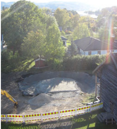
Dammen er gravd ut.