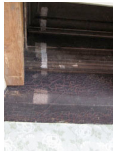
Bilde 2. Fargeprøve himling.

Videre trinn i prosjektet blir restaurering av ytterligere to rom, restaurering av flere 1700-talls tapetrester og sortering og systematisering av en stor mengde 1800- og 1900-talls papirtapeter.