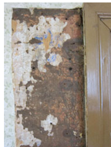
Bilde 4. Lerretsrest.