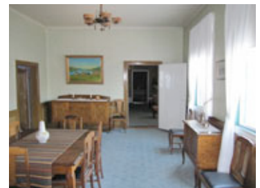
Bilde 1. Fateburet med tapet fra 1985.