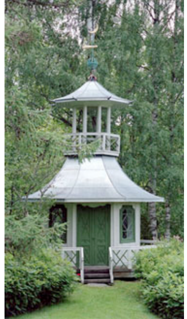
Lysthuset på Odals Værk som er forbilde for vårt lysthus.