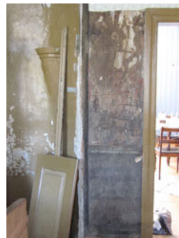
Bilde 3. Fateburet fra NIKUs undersøkelser.