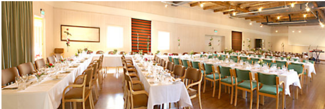
Storsalen på låven